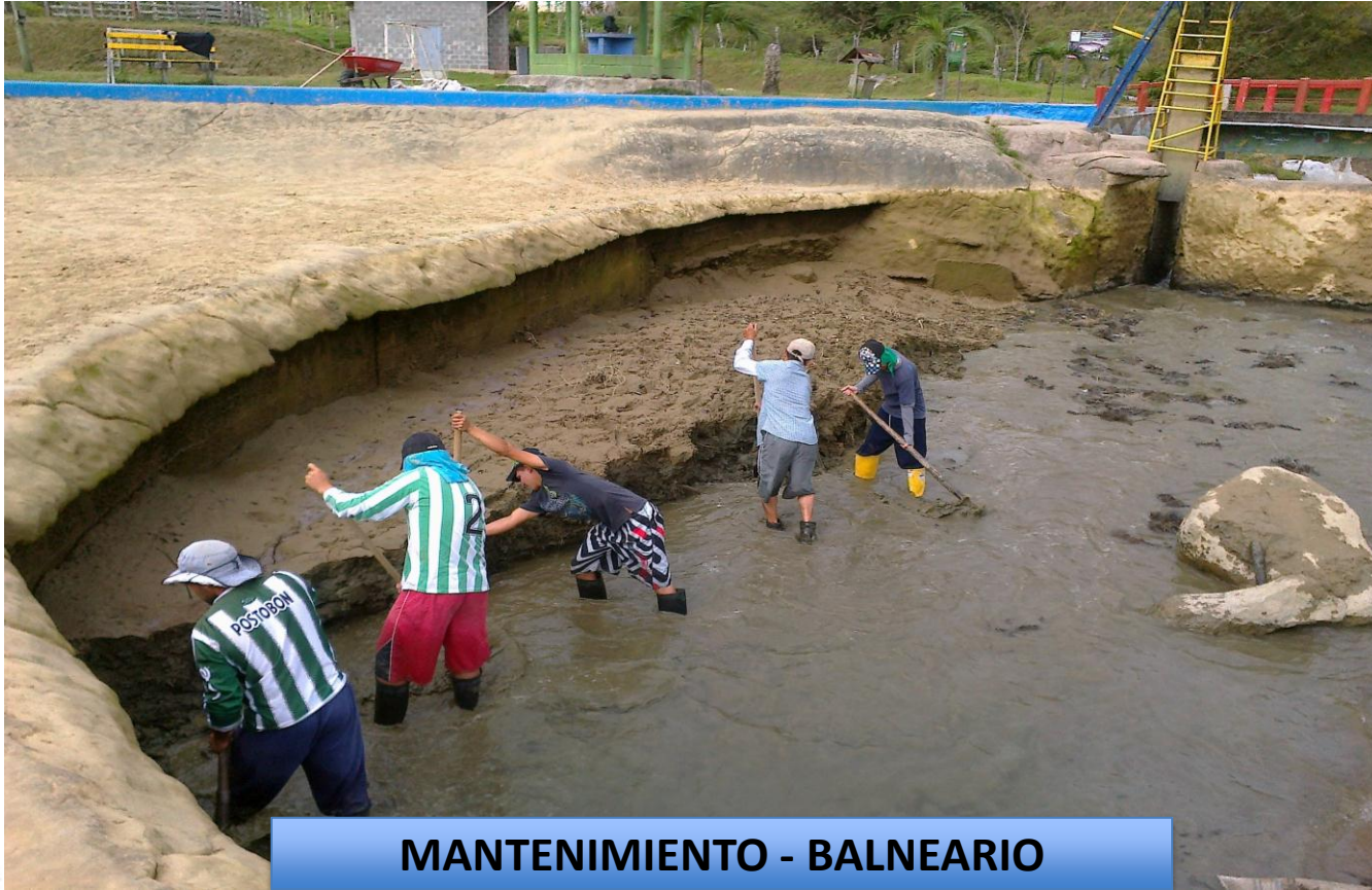
MANTENIMIENTO - BALNEARIO