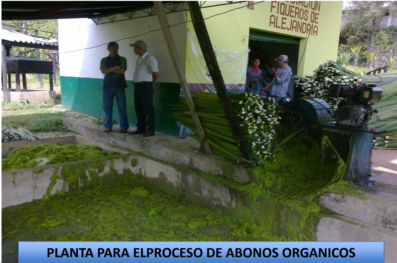
PLANTA PARA EL PROCESO DE ABONOS ORGANICOS