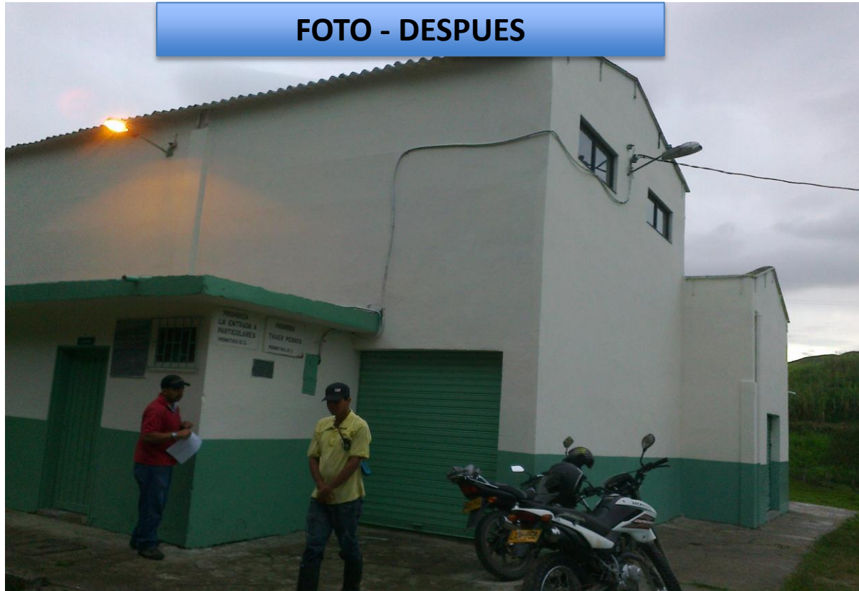
FOTO - DESPUES